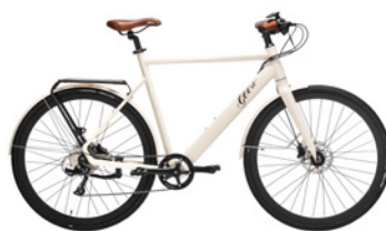
Cream Soda Beige