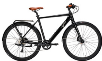
Vintage Vinyl Black (Schwarz)