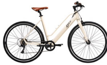
Cream Soda Beige