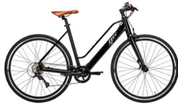
Vintage Vinyl Black (Schwarz)