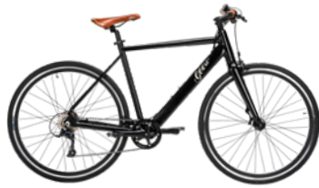
Vintage Vinyl Black (Schwarz)