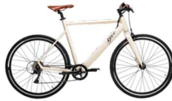
Cream Soda Beige