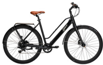
Vintage Vinyl Black (Schwarz)