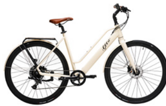
Cream Soda Beige