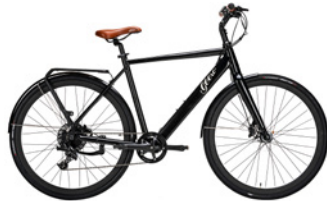
Vintage Vinyl Black (Schwarz)